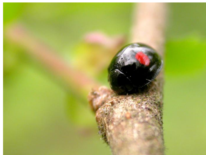
Coccinelle des saules

Chez les insectes , un redoux significatif après quelques jours de gel a fait sortir la Coccinelle à 7 points de sa torpeur hivernale : jusqu'à 5 individus actifs sur des murs du 23 au 25 janv. à Merlimont ; 4 autres tout aussi actifs sur un mur le 25 janv. à Cucq (Stella-Plage) avec un spécimen engourdi de Coccinelle des saules .