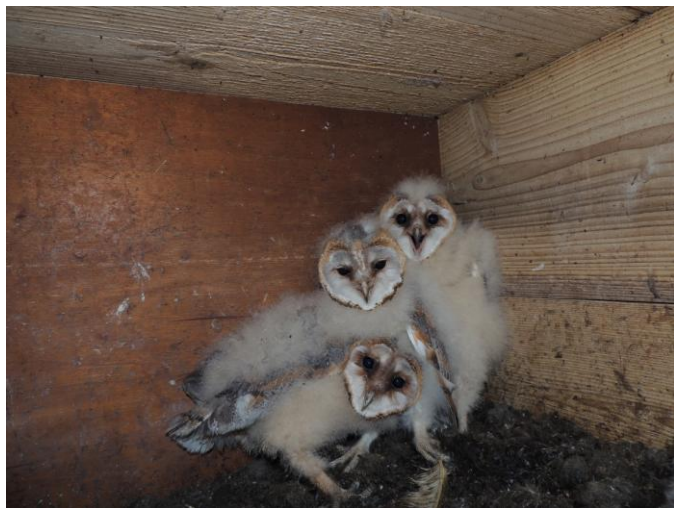
Niché d'Effraie lors de la remise en place d'un jeune tombé.

Ces résultats sont en constante amélioration du fait d'un gros effort de déplacement de nichoirs afin de leur trouver les emplacements les plus favorables au sein des exploitations.