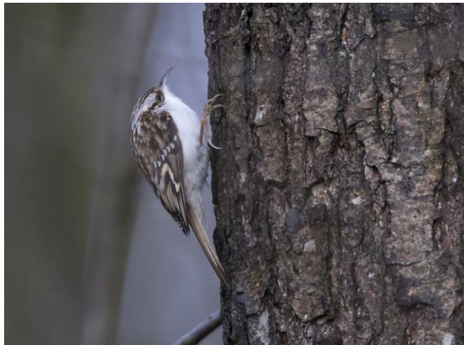
Grimpeur des bois

adultes découverts début déc. étaient toujours présents le 16 fév.