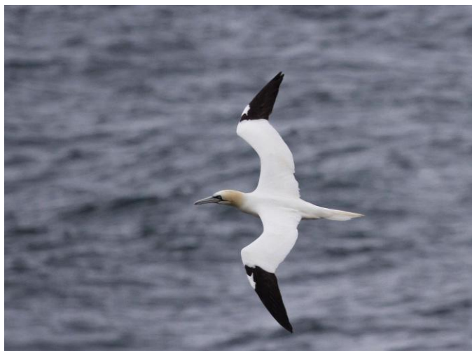
Fou de bassan

Entre le 04 et le 08/11/15, un groupe de Fous de Bassan d'effectif variable (environ 80 ex au maximum), des adultes et quelques juvéniles de divers stades, a été observé au large de Berck depuis la base nautique des Sternes.