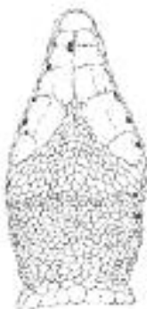
Collar liso. Pigmentación oscura escasa, más marcada en submaxilares.