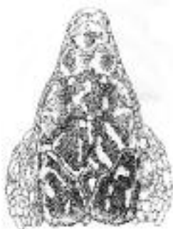
Escama internasal grande, en contacto o no con la rostral.

Una escama postnasal, en contacto con la internasal. Timpánica y masetérica pequeñas. Supratemporales estrechas, la anterior de mayor tamaño. Supranasal separada de la loreal.