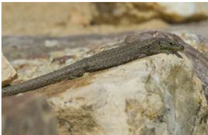
Lagartija batueca, Iberolacerta martinezricai , hembra. Peña de Francia, Salamanca.

Dorso pardo, rara vez verde o gris. Los machos tienen entre 1-3 ocelos axilares azules y las hembras entre 0-2. Los machos adultos más grandes tienen el vientre verde o azul pastel, pudiendo estar presentes ambos colores en el mismo individuo, con puntos azules en las ventrales externas; los machos juveniles lo tienen blanquecino o algo verdoso. Las hembras presentan las bandas costales uniformes, con su reborde superior irregular, con una o dos hileras irregulares de manchas alineadas en el centro del dorso, y el vientre blanco o ligeramente verdoso, especialmente hacia la garganta.